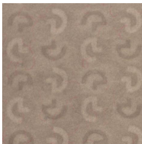
Popierius su nefiksuotu dvitonių vandens ženklu