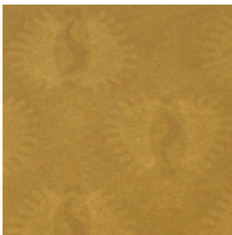
Popierius su vandens ženklų, dvitonių, nefiksuotu, pasikartojančiu