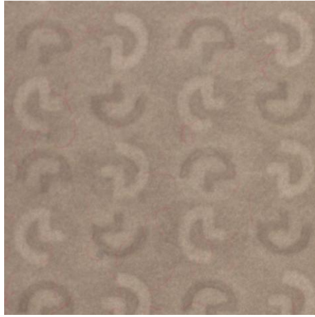
Popierius su nefiksuotu dvitoniu vandens ženklų